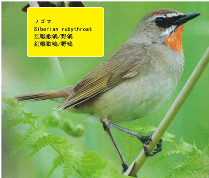
ノゴマ Siberian rubythroat 紅喉歌鴉/野鴉 紅喉歌鴉/野鴉