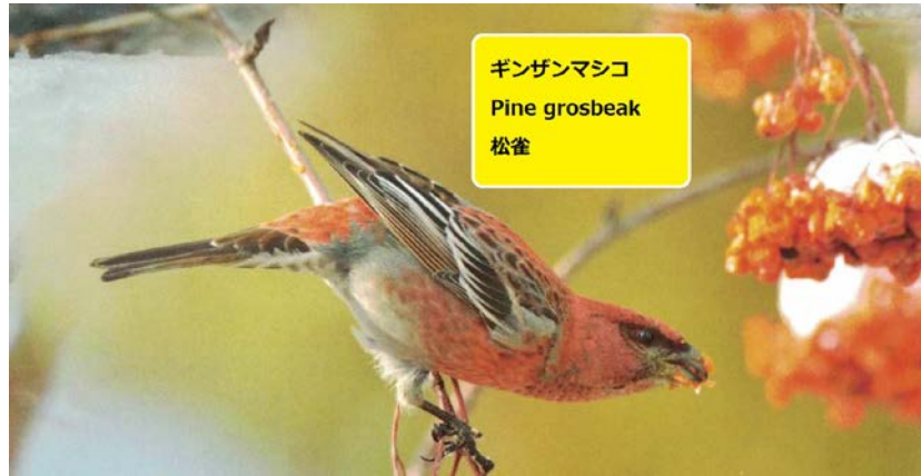
ギンザンマシコ Pine grosbeak 松雀