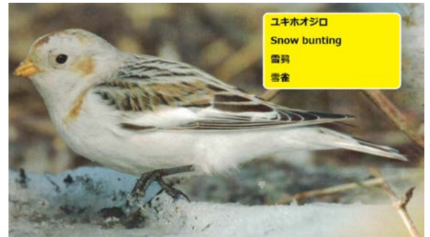
ユキホオシロ Snow bunting 雪鴉 雪雀